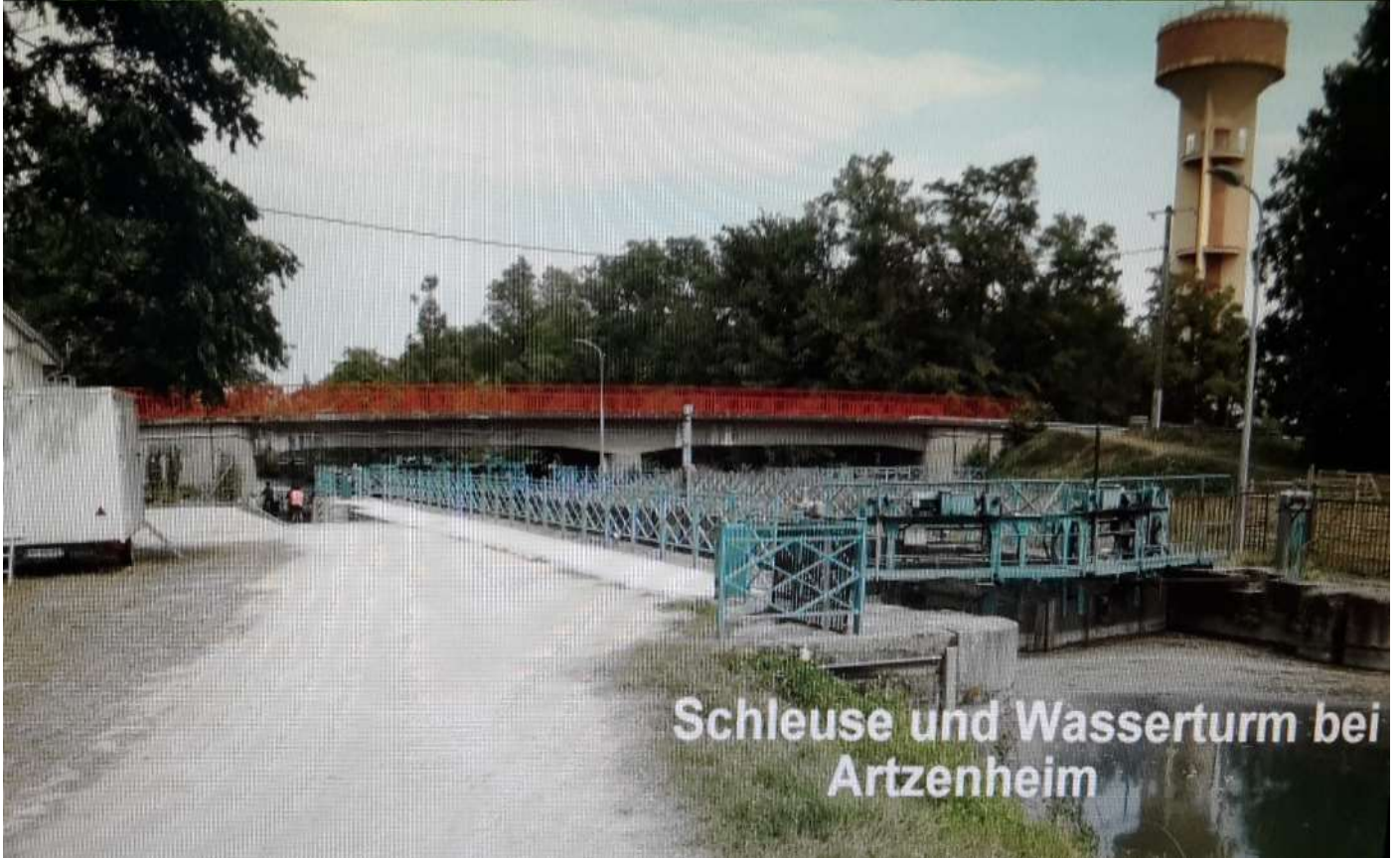
Schleuse und Wasserturm bei Artzenheim