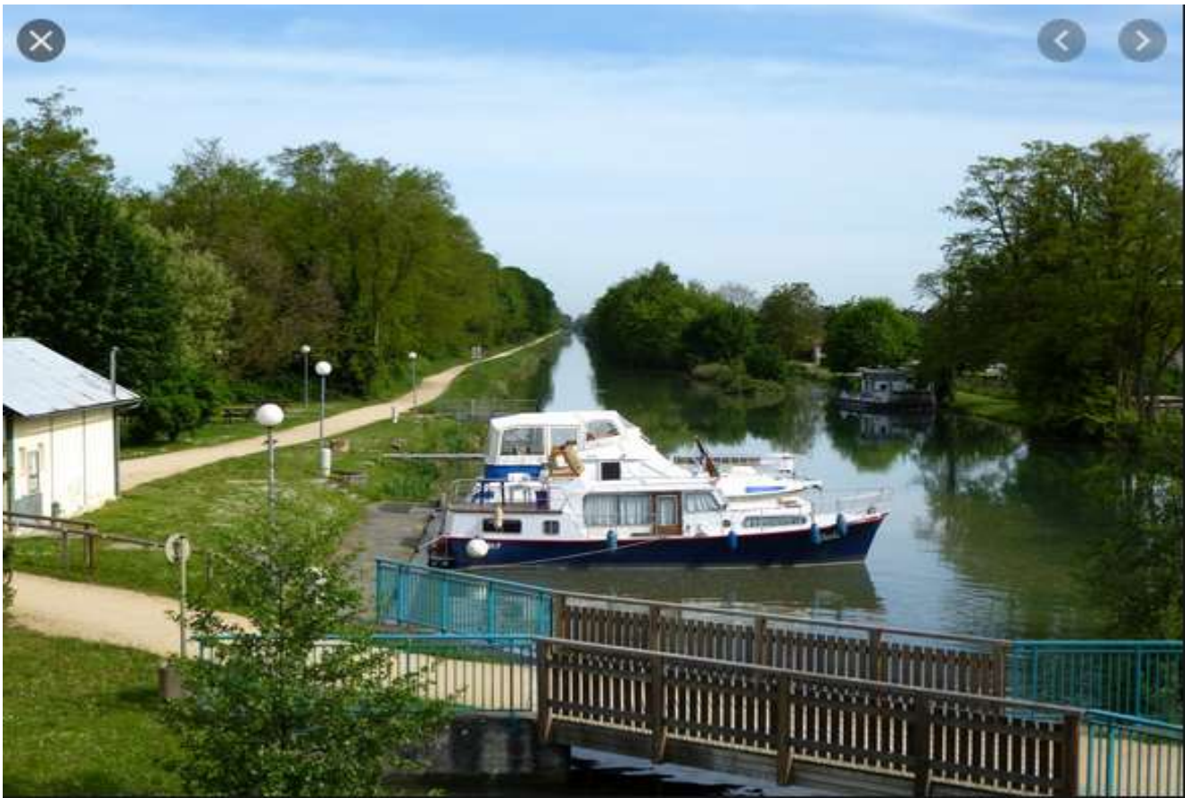
Bild oben schöner Rastplatz bei Artzenheim