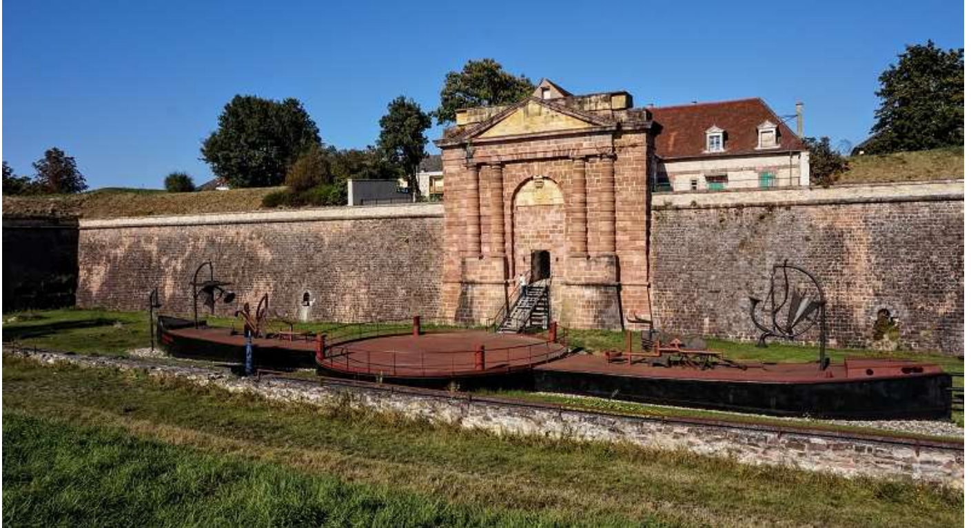
Bilder von der Festung Neuf Brisach